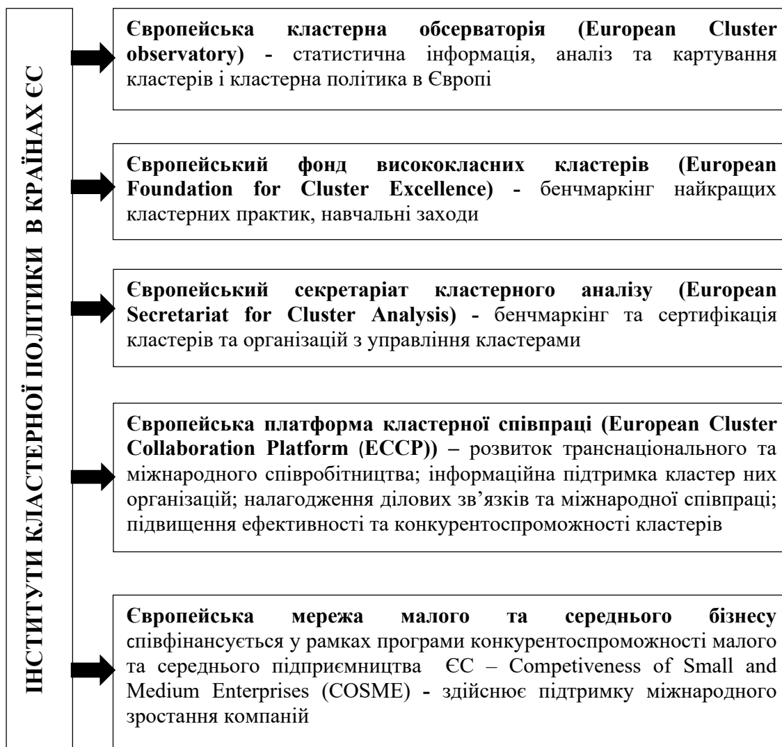
Рис. 2. Ключові інститути кластерної політики в країнах ЄС