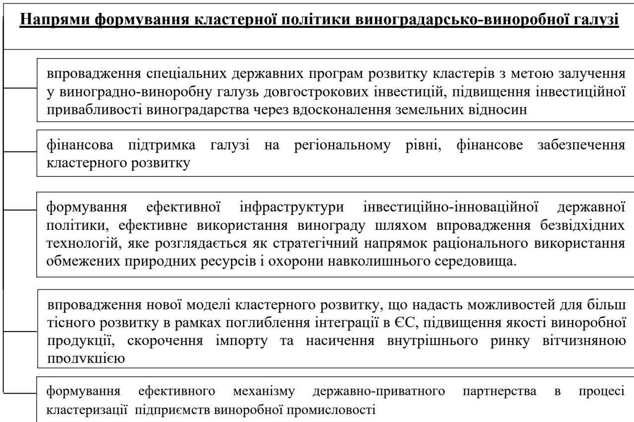
Рис. 3. Напрями кластерної політики виноградарсько-виноробної галузі