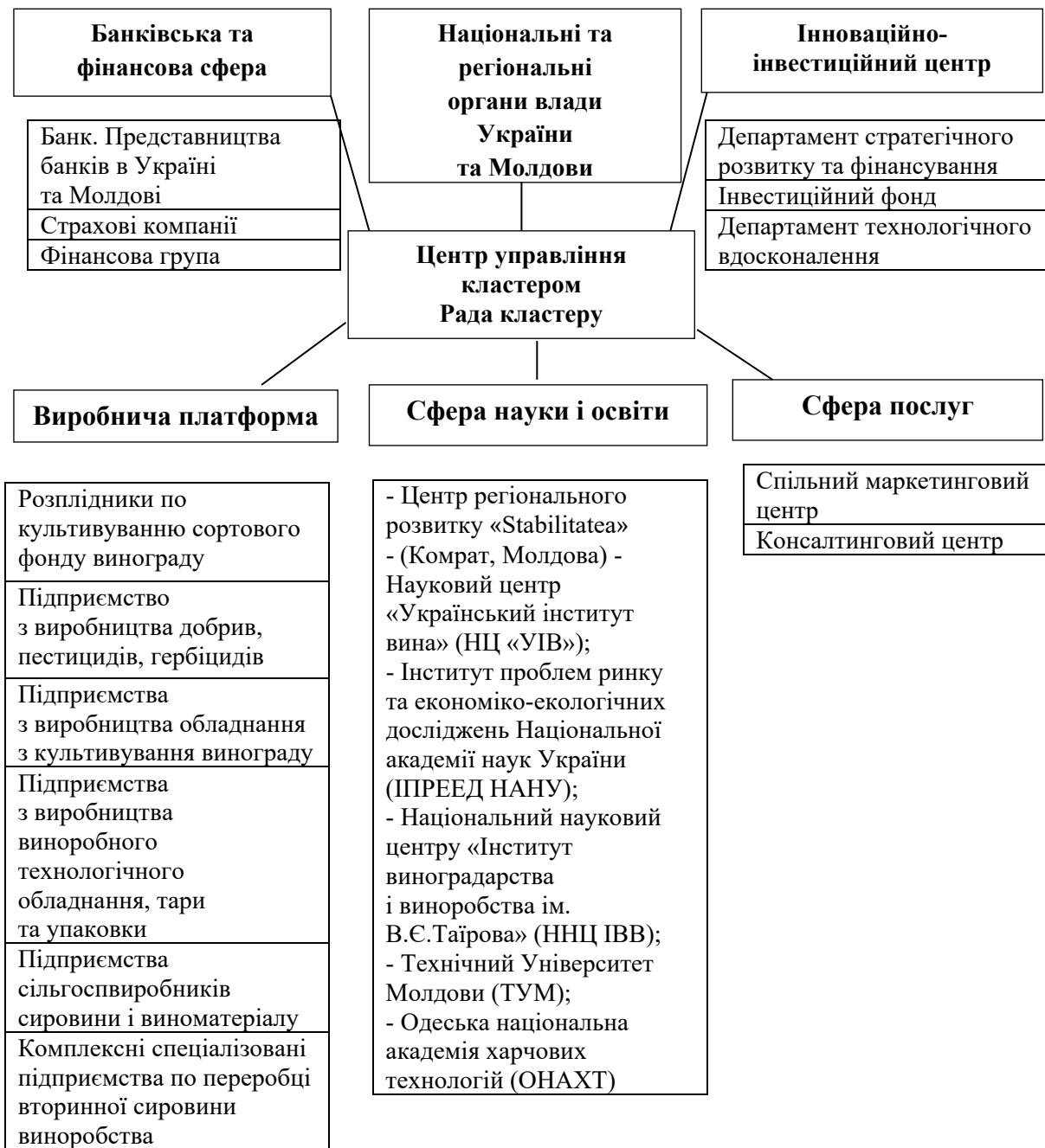
Рис. 4. Пропонована організаційна структура виробничо-науково-освітнього кластера з переробки вторинної сировини виноробства в транскордонному регіоні Україна-Молдова

Перспективи подальших розробок є проведення кластерного аналізу підприємств виноградно-виноробної промисловості та розрахунок прогнозного ефекту створення виробничо-науково-освітнього кластера з переробки вторинної сировини виноробства на регіональному, національному та світовому рівнях.