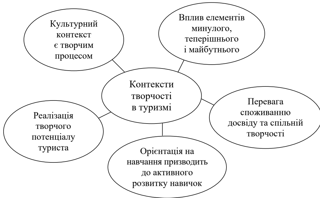
Рис. 2. Контексти творчості в туризмі