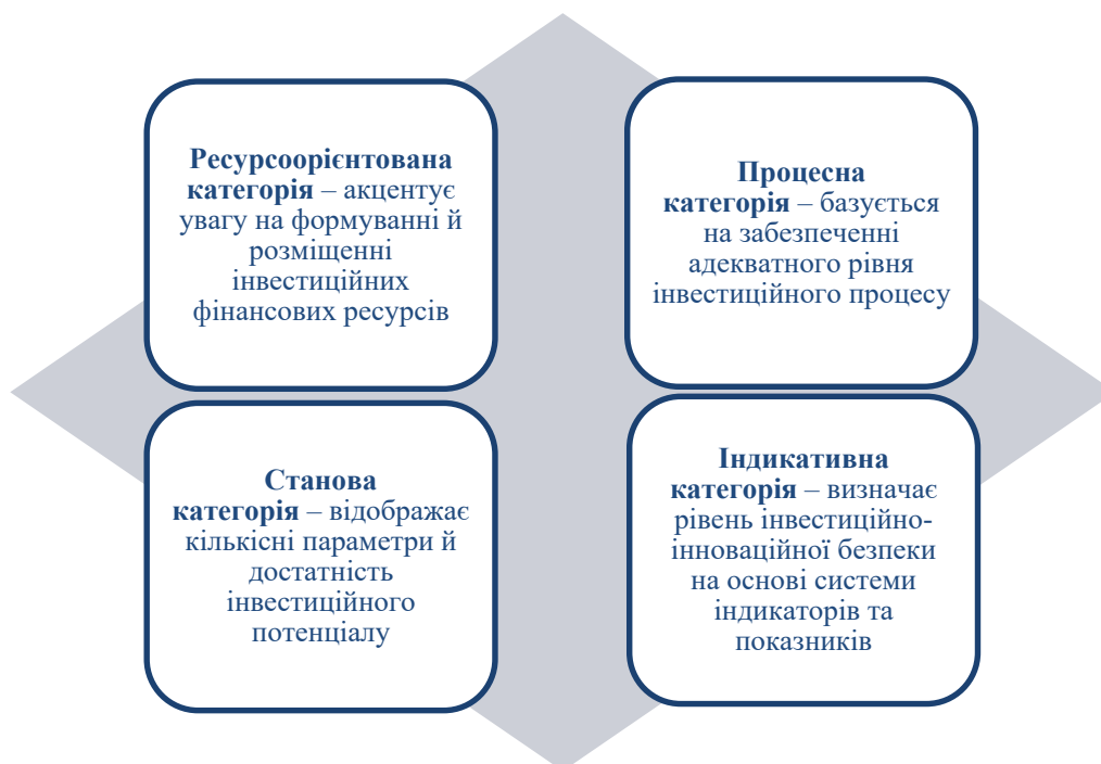
Рис. 1. Категорії теоретичних підходів до трактування дефініції «інвестиційно-інноваційна складова» в системі забезпечення сталого економічного розвитку держави

Проведене дослідження демонструє, що інвестиційно-інноваційна складова в системі забезпечення сталого економічного розвитку держави