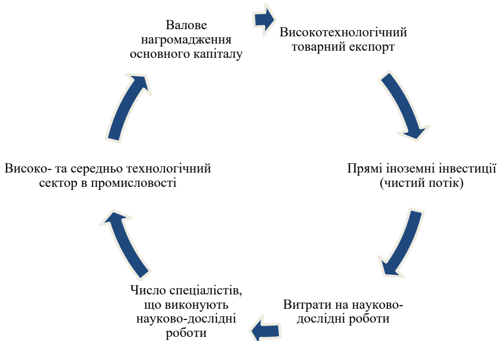
Рис. 3. Інвестиційно-інноваційні індикатори в системі забезпечення сталого економічного розвитку держави