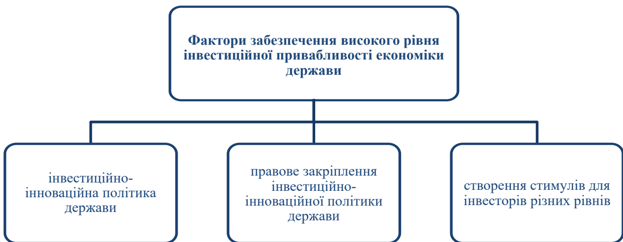
Рис. 4. Фактори забезпечення високого рівня інвестиційної привабливості економіки держави з метою її інноваційного розвитку та модернізації в системі забезпечення сталого економічного розвитку