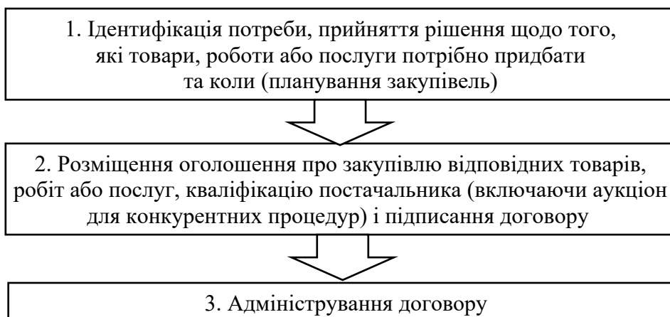
Рис. 1. Загальний алгоритм проведення публічних закупівель

Відповідно, управління результативністю закупівельної діяльності – це процес розробки/впровадження стратегії закупівель із головною метою – досягнення цілей суб'єкта шляхом встановлення організаційних структур, процедур, функціональних ролей (посадових інструкцій) та створення сприятливого середовища для ефективного та дієвого виконання функції закупівель.