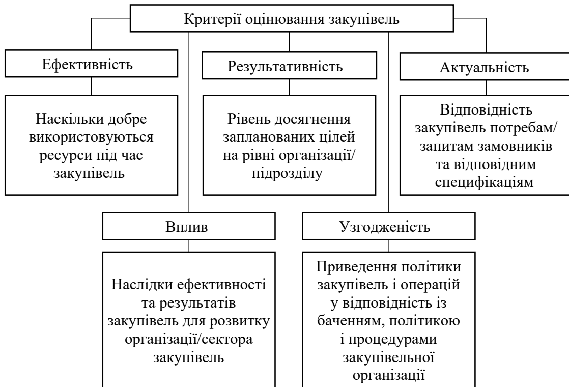
Рис. 3. Критерії оцінювання закупівель