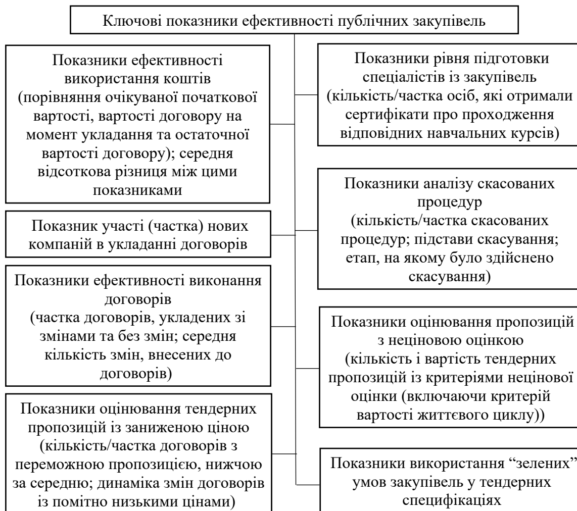
Рис. 5. Ключові показники ефективності публічних закупівель

Це основний спосіб виявлення ефективності використання державних коштів, а також недоліків і правопорушень у даній сфері, що значно підвищить їх ефективність в забезпеченні потреб держави і територіальних громад у товарах, роботах та послугах.