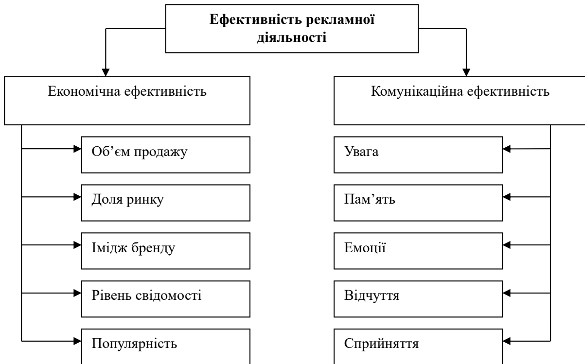
Рис. 2. Показники оцінки ефективності реклами