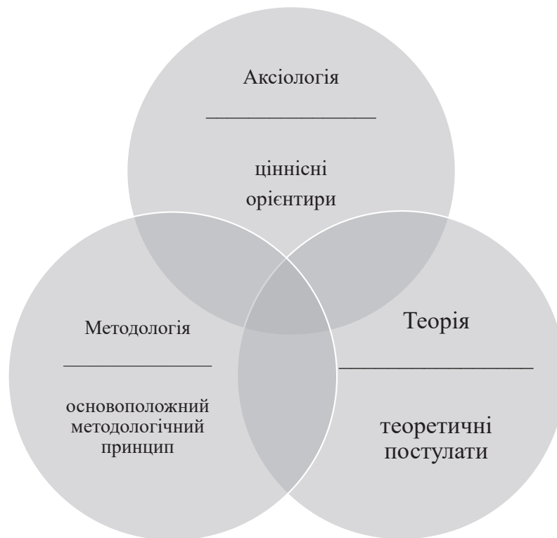
Рис. 1. Складові елементи парадигми процесів та явищ