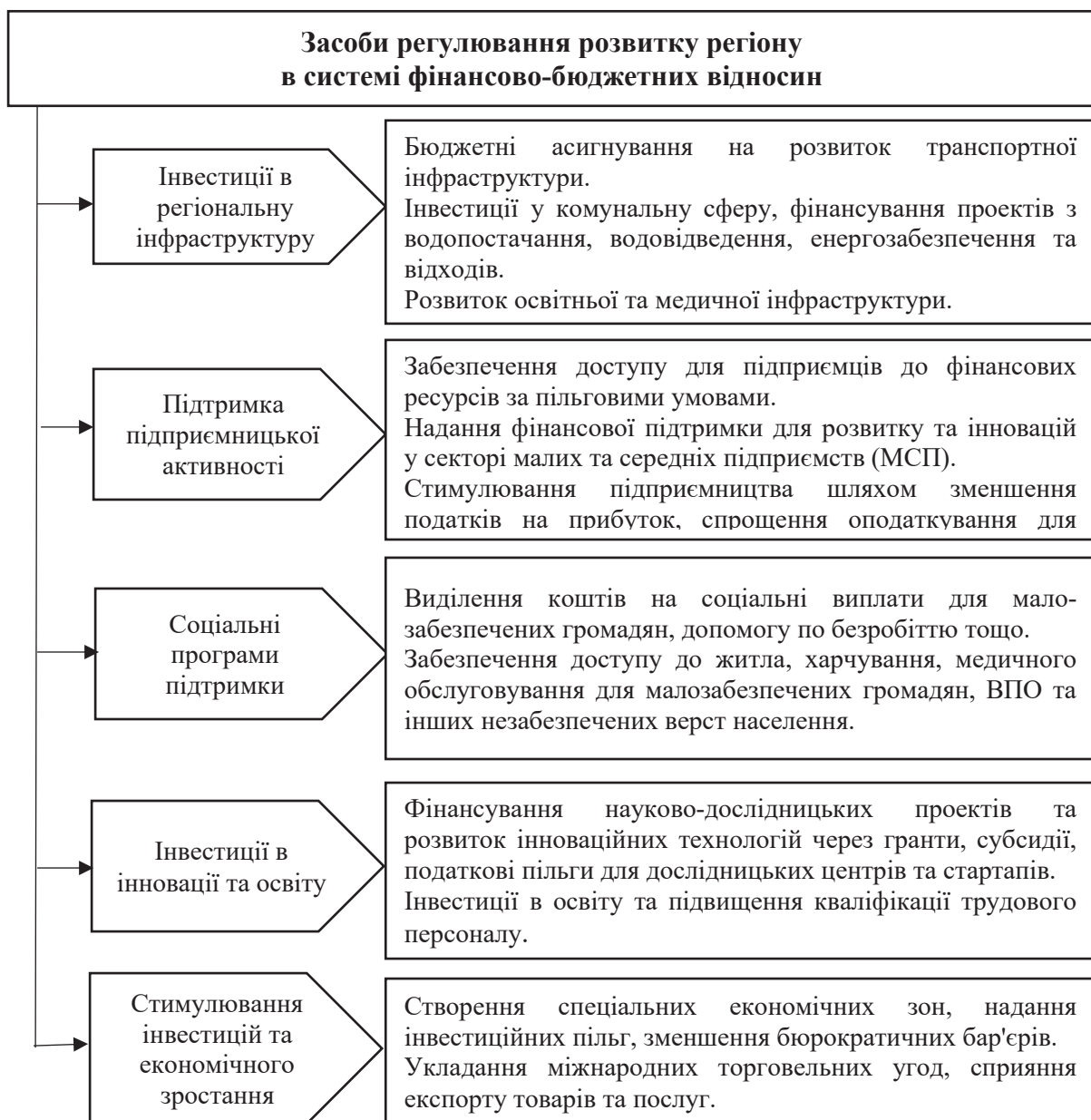
Рис. 2 Характеристика засобів регулювання розвитку регіону в системі фінансово-бюджетних відносин

Висновки і перспективи подальших досліджень у даному напрямі. Запропоновані засоби можна використовувати для