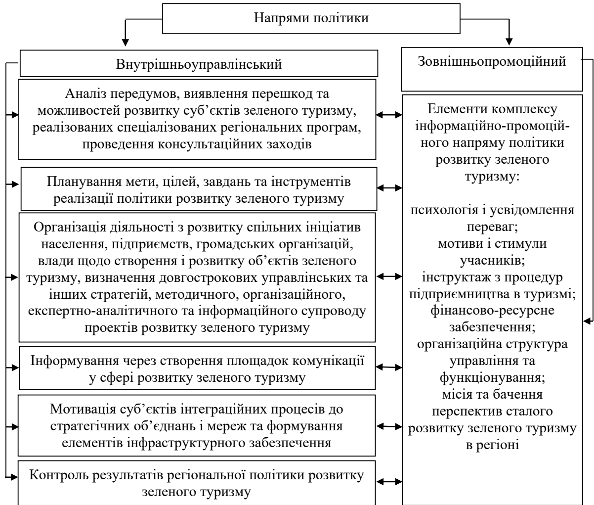
Рис. 2. Напрями та засоби реалізації регіональної політики розвитку об'єктів зеленого туризму в Карпатському регіоні України