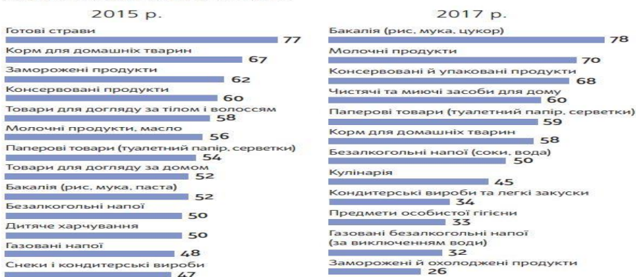
Рис. 2. Товари власних торгових марок, що закуповувались українськими споживачами в 2015-2017 р.р., %

Джерело: За даними компанії Nielsen Ukraine