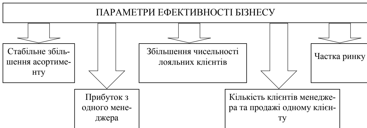
Рис. 2. Параметри ефективності бізнесу (побудовано автором)

Оцінювання описаних вище показників ефективності по одному дасть інформацію про якість лише одного з бізнес-процесів – якщо ж звести їх в систему, можна судити про ефективність бізнесу в цілому.