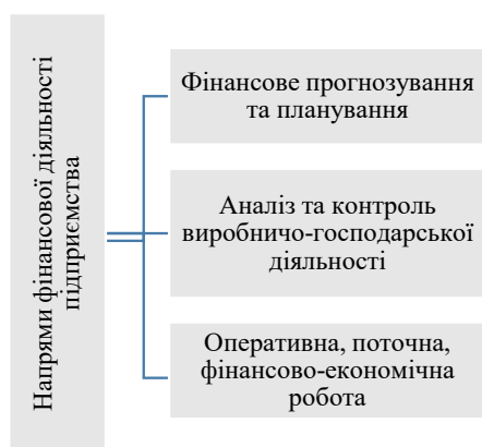
Рис. 1. Загальні напрями фінансової діяльності підприємств

Визначимо загальні напрями фінансової діяльності підприємств (рис. 1).