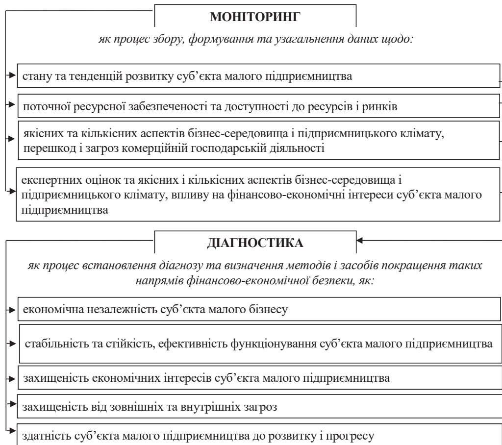
Рис. 2. Методична послідовність моніторингу і діагностики фінансово-економічної безпеки суб'єктів малого підприємництва

Висновки з проведеного дослідження. Забезпечення фінансово-економічної безпеки суб'єктів малого підприємництва є важливим завданням державної політики як передумови активізації підприємницької діяльності, що виступає вагомим чинником соціально-економічного розвитку та безпеки, дає змогу посилити інноваційний складник конкурентоспроможності національної економіки.