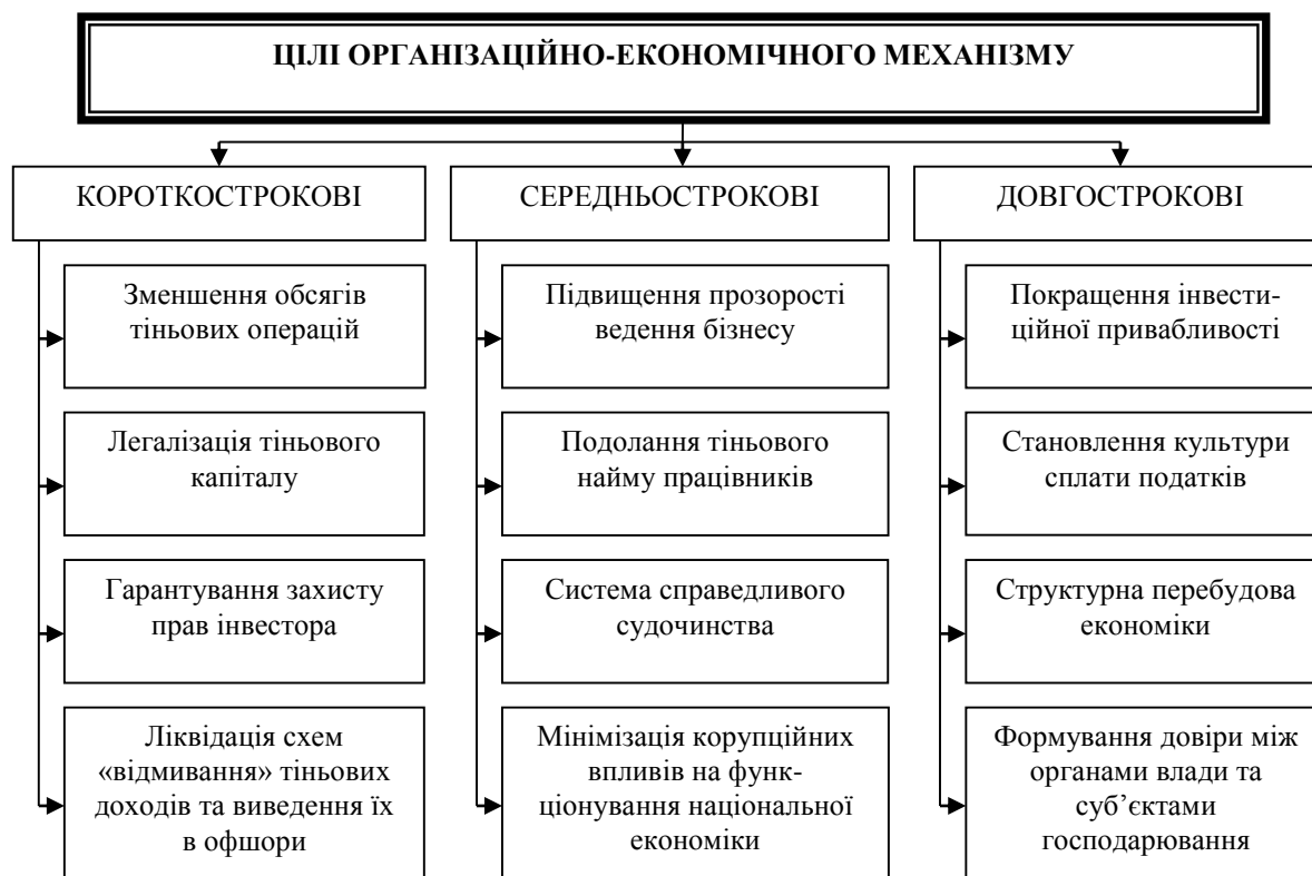
Рис. 1. Систематизація цілей організаційно-економічного механізму детінізації відносин у базових видах економічної діяльності

З метою досягнення визначених стратегічних пріоритетів формування адекватної структурної будови організаційно-економічного механізму детінізації відносин у базових видах економічної діяльності доцільною є орієнтація на реалізацію таких заходів: