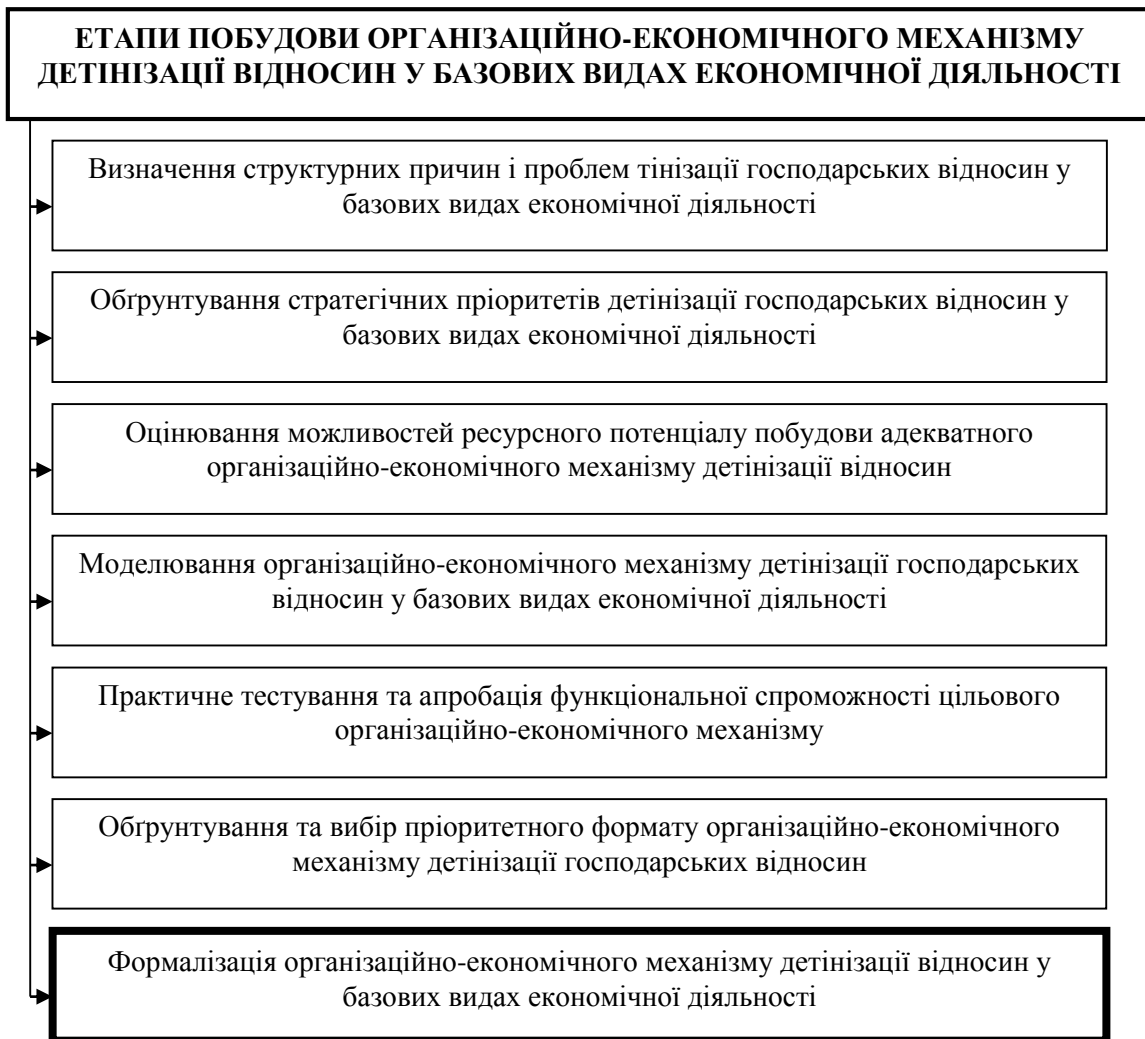
Рис. 2. Структуризація етапів побудови організаційно-економічного механізму детінізації відносин у базових видах економічної діяльності

– подолання неповноти, розбалансованості та розбіжностей інституційного забезпечення детінізації господарських відносин у базових видах економічної діяльності на засадах усунення інституційних пасток, узгодження управлінських впливів між формальними та неформальними інституціями, завершення процесу формування цілісної інфраструктури протидії дестабілізуючим корупційним впливам на розвиток економічних відносин (запуск роботи Державного бюро розслідування, створення та формування якісного кадрового забезпечення роботи Антикорупційного суду, внесення змін до чинного Кримінального кодексу України щодо унеможливлення виходу під заставу особам у процесі досудового слідства, які підозрюються у вчиненні масштабних корупційних злочинів, доведення судових справ до винесення реальних вироків позбавлення волі для топ-корупціонерів, усунення інституційних прогалин протидії здійсненню рейдерських атак на функціонування суб'єктів господарювання, унеможливлення використання інструментів вибіркового правосуддя, дотримання принципу невідворотності покарання);