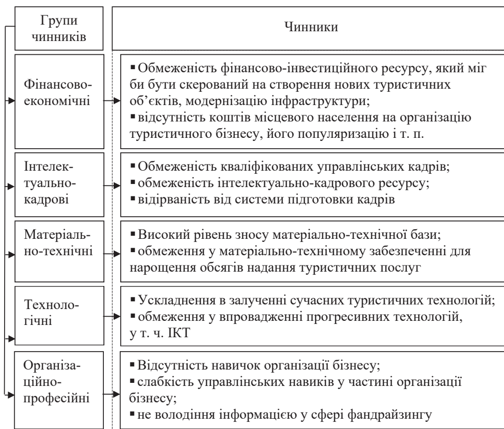
Рис. 1. Чинники, які перешкоджають розвитку зеленого туризму в Україні (до повномасштабної війни)