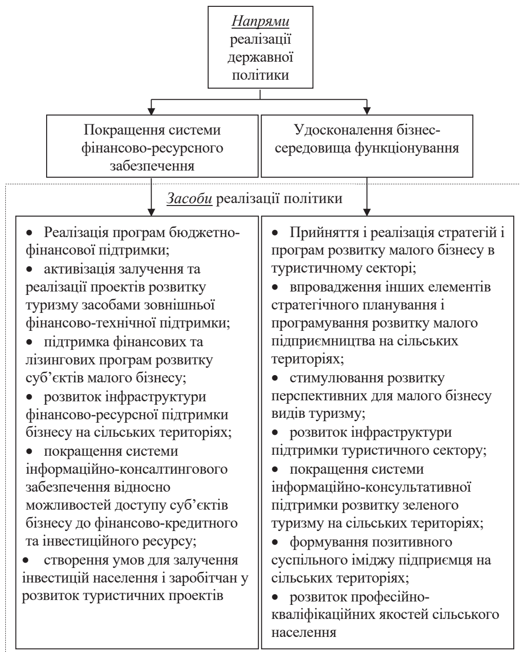
Рис. 3. Напрями та засоби державної політики реалізації потенціалу розвитку зеленого туризму в Україні

З іншого боку, потребує свого покращення і бізнес-середовище, що, як відомо, в нашій державі не характеризується високим рівнем сприятливості. Йдеться про монополізацію більшості ринків, зрощення бізнесу та влади, а відтак використання адміністративного ресурсу, у т. ч. в цілях створення тиску на конкурентів, надмірне фіскальне наванта-