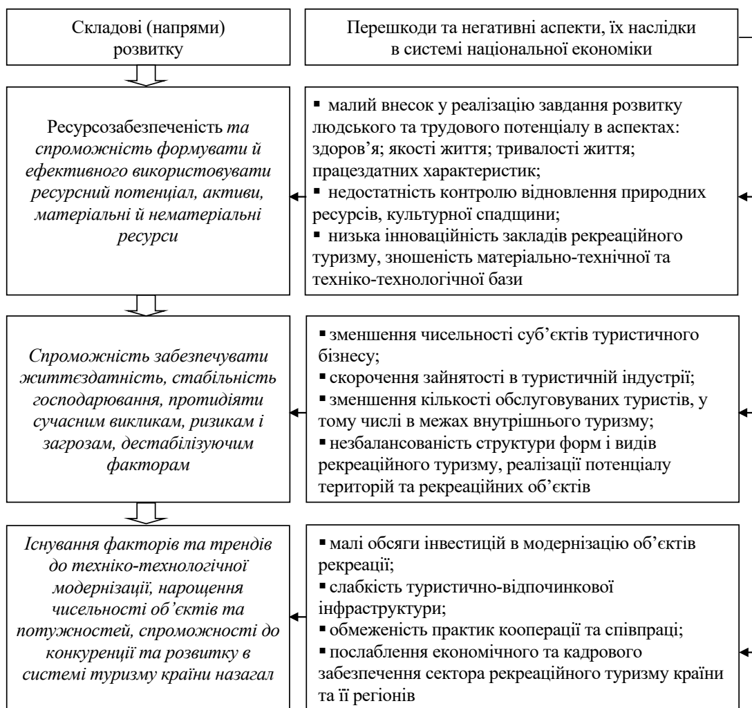
Рис. 1. Результати узагальнення стану і тенденцій розвитку рекреаційного туризму в Україні