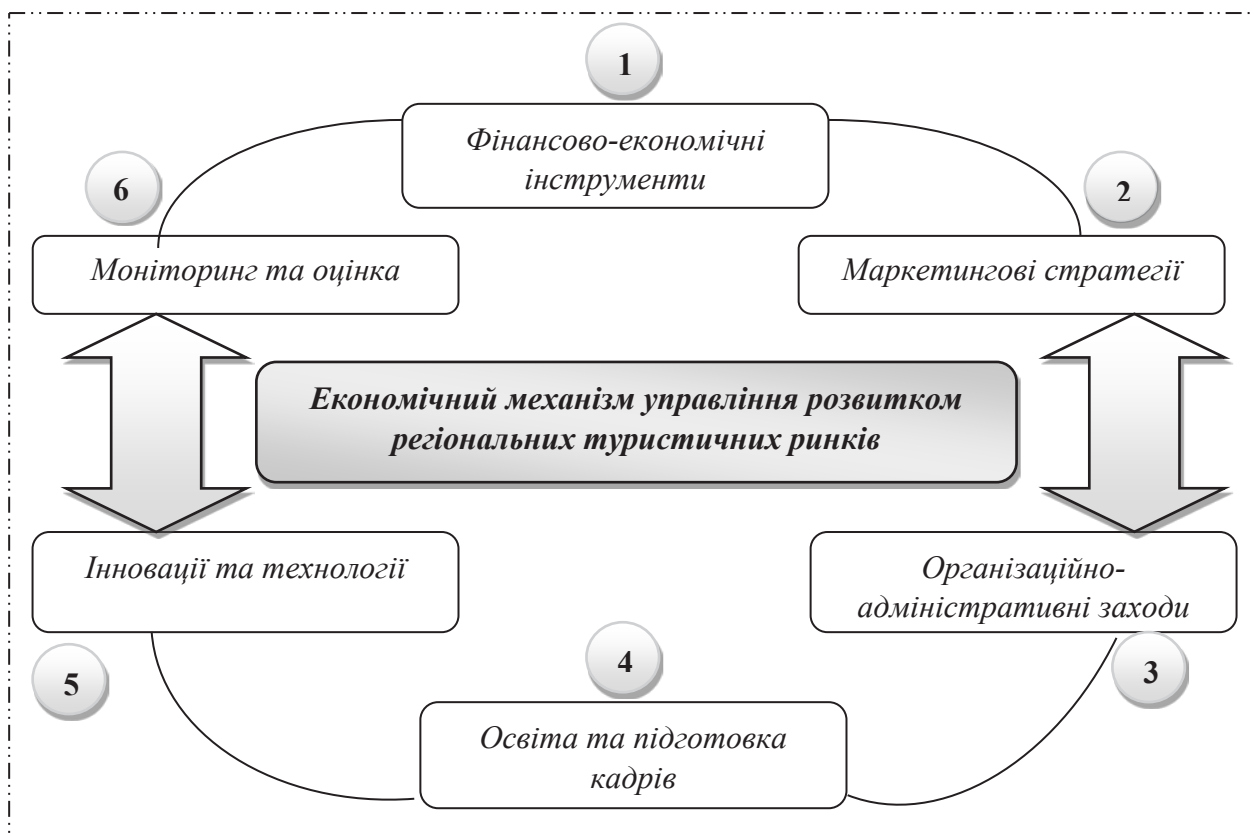
Рис. 2. Економічний механізм управління розвитком регіональних туристичних ринків

Маркетингові стратегії включають в себе: брендування регіону, як творення та просування унікального бренду регіону, який би відображав його культурні, природні та історичні особливості, рекламні кампанії, як проведення національних та міжнародних рекламних кампаній для привернення уваги