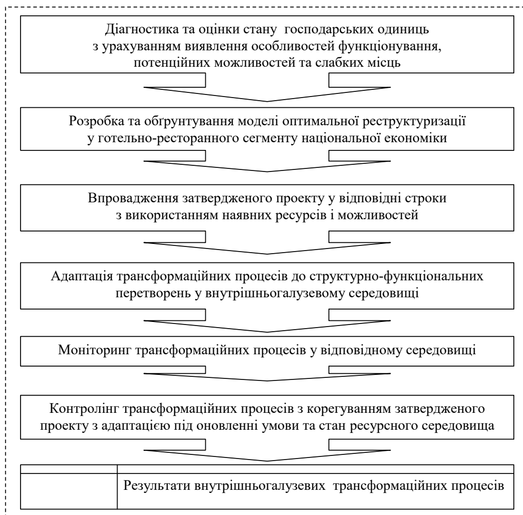
Рис. 1. Послідовність процесу трансформації у готельно-ресторанного сегменту національної економіки

менту національної економіки та отримати певні дивіденди для розвитку туристичної сфери країни в умовах інтеграції та глобалізації.