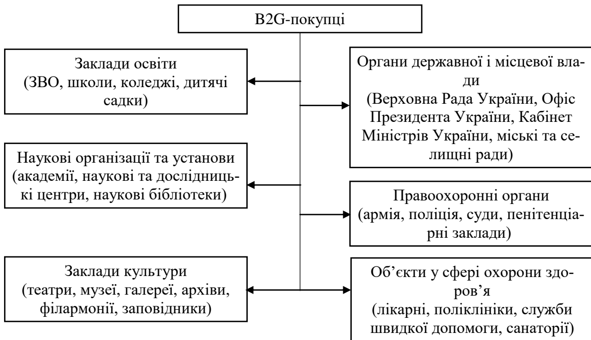
Рис. 2. Основні категорії покупців у системі B2G в Україні