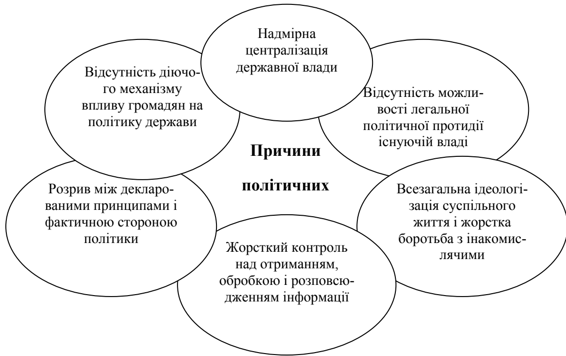
Рис. 2. Причини політичних конфліктів у тоталітарних режимах

Побудовано авторами за джерелами [1; 3].