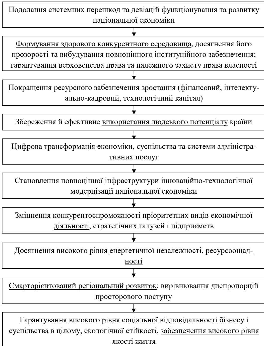
Рис. 1. Концептуальна модель стабільного макроекономічного зростання України: 10 принципів кроків