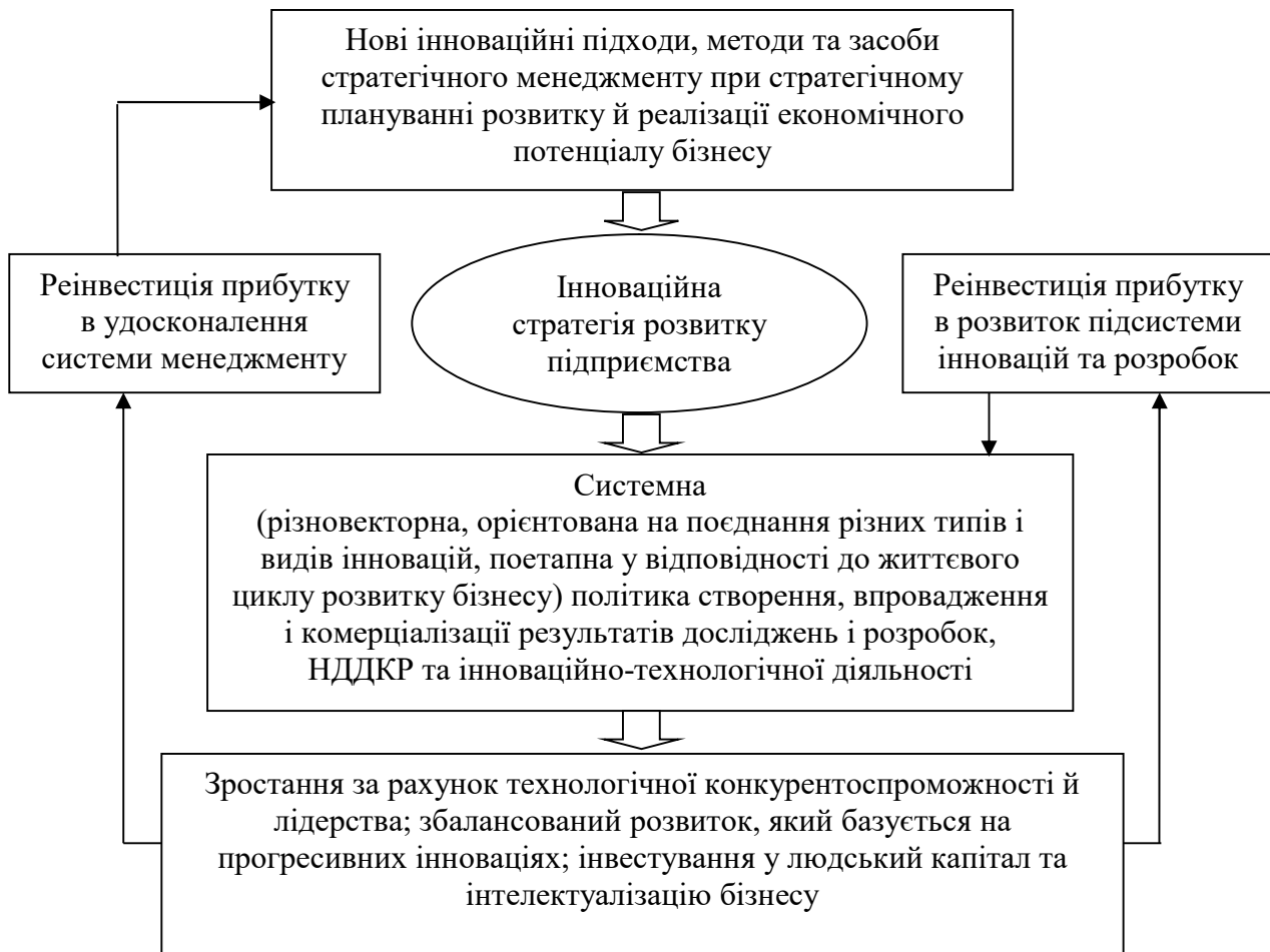
Рис. 1. Концепт нового бачення інноваційної стратегії розвитку підприємства

Такий метод дозволяє надати наступне визначення досліджуваному поняттю, а саме: інноваційна стратегія розвитку бізнесу – це загальний план, що орієнтований на досягнення мети і стратегічних цілей розвитку підприємства у довгостроковій перспективі, який розробляється (та, відповідно, реалізується) зі застосуванням новативних підходів до стратегічного менеджменту та інструментарій якого передбачає зростання й реалізацію фінансово-економічних інтересів стейкхолдерів за рахунок системної й ефективної інноваційно-технологічної активності (рис. 1).