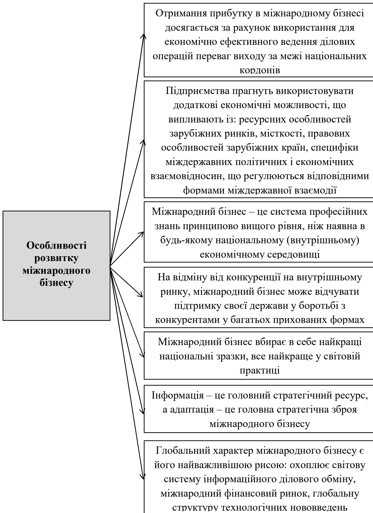
Рис. 2. Особливості розвитку міжнародного бізнесу, виходячи із змінюваних ринкових умов