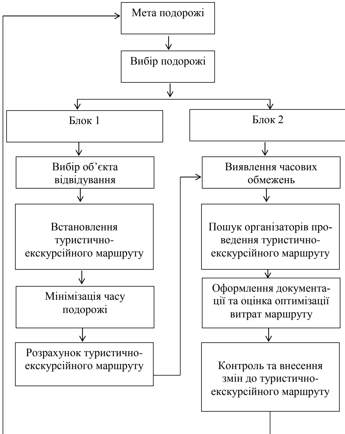
Рис. 2. Послідовність організації туристично-екскурсійного маршруту для осіб з інвалідністю

Отже, організація туристично-екскурсійного маршруту передбачає здійснення комплексу дій, які описано в блоці 1, що дає змогу спростити складність дій під час їх виконання. Блок 2 передбачає вирішення організаційних питань оформлення документації завершення схеми маршруту та контроль за реалізацією туристично-екскурсійного маршруту.