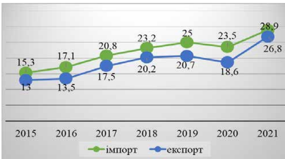
Рис. 3. Розрахунки в імпорتنних / експортних операціях, млрд USD

або декларації, заповненої особою, що перевозить даний товар, за формою згідно з додатком, без застосування заходів нетарифного регулювання зовнішньоекономічної діяльності.