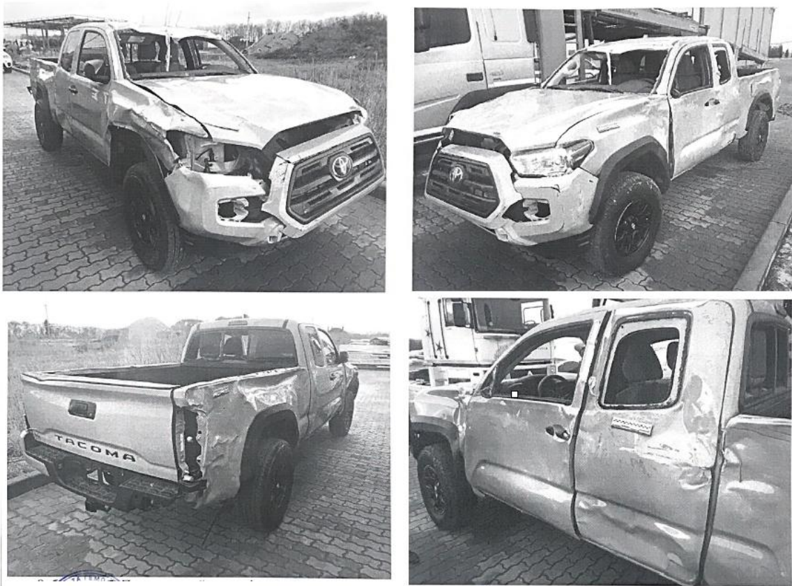
Рис. 2. Оцінюваний транспортний засіб марки “Toyota Tacoma”, представлений на дослідження