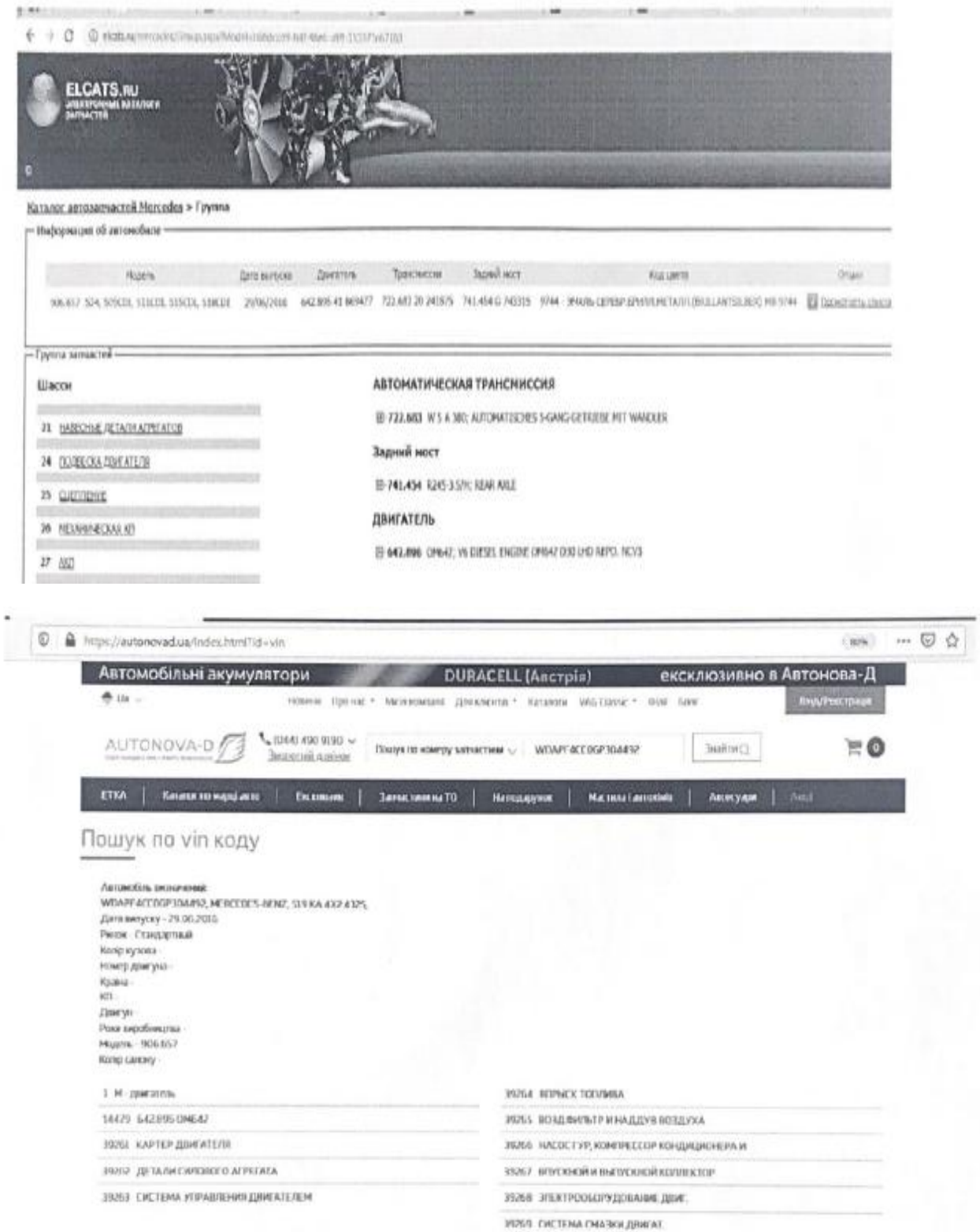
Рис. 5. Перевірка VIN-коду за допомогою спеціалізованих інтернет-ресурсів

Висновки і перспективи подальших досліджень у даному напрямі. Світовий автомобільний ринок конкурентний та динамічний у своєму розвитку, здатний реагувати на зміни в соціально-економічному становищі в розрізі кожної країни. Розвиток вторинного ринку автомобілів в Україні