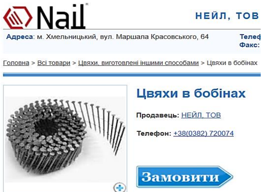
Рис. 2. Цвяхи зі скошеним зрізом у бобінах