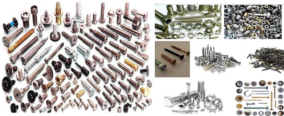
Рис. 1. Новітні кріпильні вироби, які пропонує ТОВ “Епіцентр К”

Практично це означає, що класифікація (віднесення) в експертному товарознавчому дослідженні відповідно до даної методики [11], наприклад, цвяхів, у товарну підгрупу “метизи”, зонайменше – некоректна, оскільки за чинними нормативними документами (наприклад, ДСТУ) і класифікаторами (наприклад, УКТЗЕД, ГС та ін.) такої товарної підгрупи не існує.