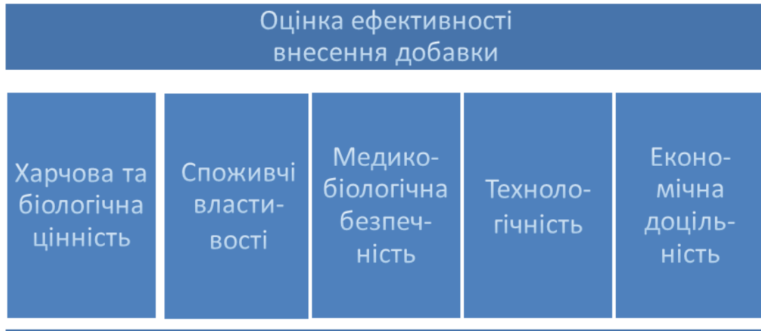
Рис. 2. Умови ефективності внесення добавок

Використання активованих вод при виробництві м'ясних виробів: відкриває можливості зниження кількості застосовуваних харчових кислот і фосфатів; забруднення готових виробів хлоридами, фторидами і нітратами; створює передумови одержання екологічно чистішої продукції, без хімічних складових частин і підвищення якісних показників розчинених харчових добавок, які регулюють функціонально-технологічні властивості білоквмісних систем і готових виробів. Застосування електроактивованої води, отриманої в результаті уніполярного електрохімічного виливу в діафрагменних електроактиваторах, є одним з найбільш перспективних способів безреагентного регулювання властивостей різних систем і знаходить все більше застосування в різних галузях господарювання. Підвищений енергетичний рівень і висока реакційна здатність електроактивованих середовищ є важливою перевагою при їх використанні для виробництва м'ясопродуктів, оскільки з їх допомогою можливо направлено регулювання функціонально-технологічних властивостей м'ясних систем без внесення різних доповнювачів. Це особливо важливо для підвищення рівня екологічності, нешкідливості та безпеки продуктів харчування.