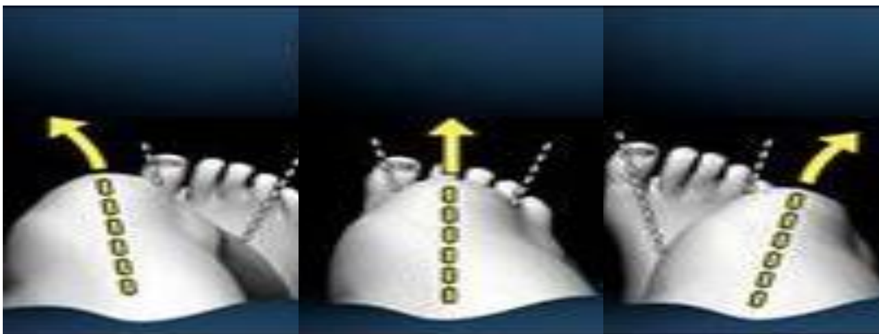
Рис. 1. Вплив морфології тіла людини на опускання стопи на опору [10]

Відомо, що важливою складовою частиною призначення взуття є забезпечення нормального функціонування нижніх кінцівок під час стояння і пересування, яке забезпечується відповідністю взуття морфологічним властивостям стопи, особливостям функціонування, розмірам тощо [6]. Зокрема, при невідповідності взуття розмірам і формі стопи остання може деформуватися і рівень такої деформації залежить від особливостей морфології (наприклад, будова колінного суглобу впливає на напрям його руху і напрям стопи в цілому під час опускання на опору) та особливостей конструкції взуття, яке використовується для певного виду туризму (рис. 1).