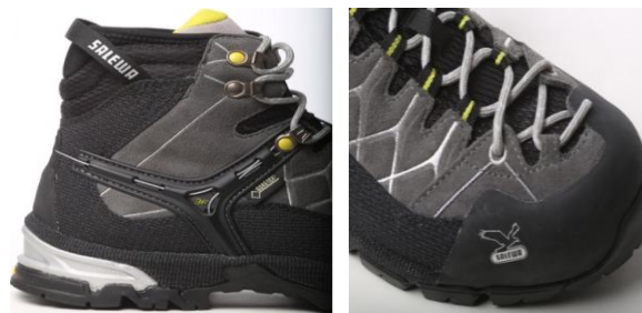
Рис. 3. Вплив взуття на біомеханічні властивості стопи

ристик центру тяжіння при використанні взуття за призначенням; об’єктивних показників оцінювання ступеня зручності взуття і впливу на загальний стан людини [12-13] (рис. 3).