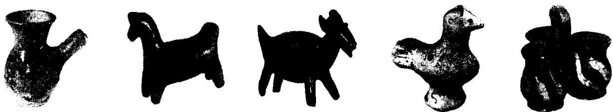
Рис. 1. Взірці народної української іграшки XVIII–XIX ст. [5]

Аналіз останніх досліджень і публікацій. Іграшки – це галузь українського народного мистецтва, що об'єднує вироби з кераміки, дерева, лози, соломи, паперу та ін. Іграшка при всій своїй різноманітності й багатофункціональності залишається важливим засобом виховання дітей. Саме через спрощені іграшки-знаки дитина пізнає світ, навчається мислити узагальненими поняттями та яскравими образами, врешті вона приєднується до одного з джерел народного мистецтва.