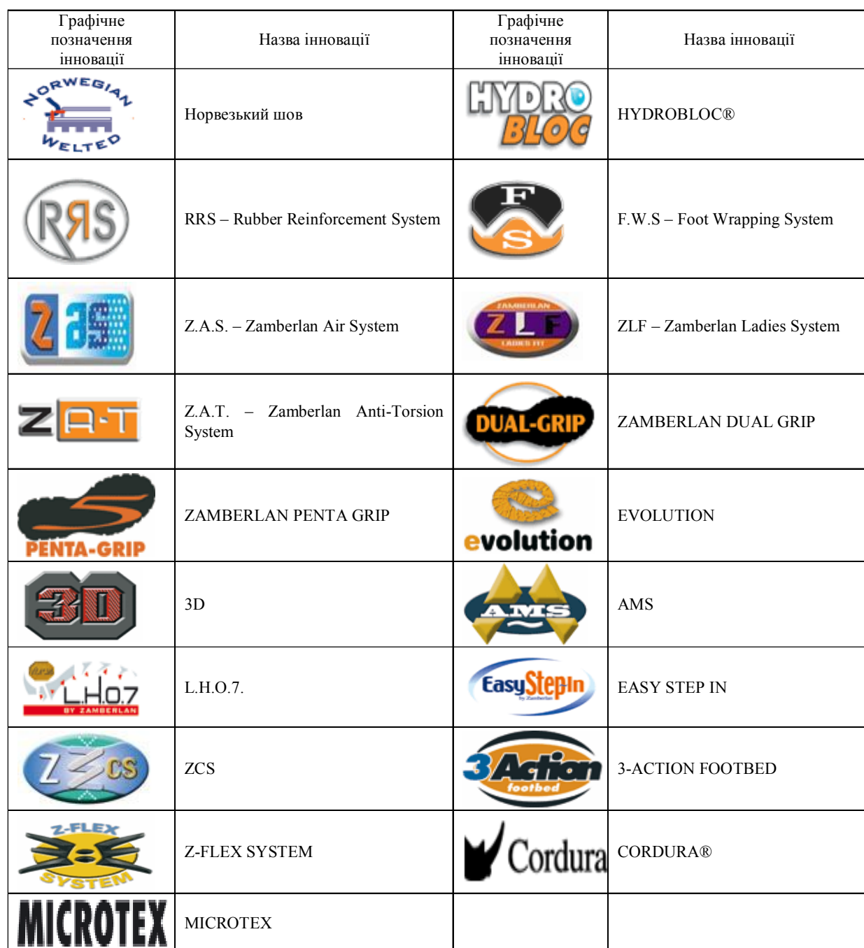
Назва і позначення інновацій у туристичному взутті