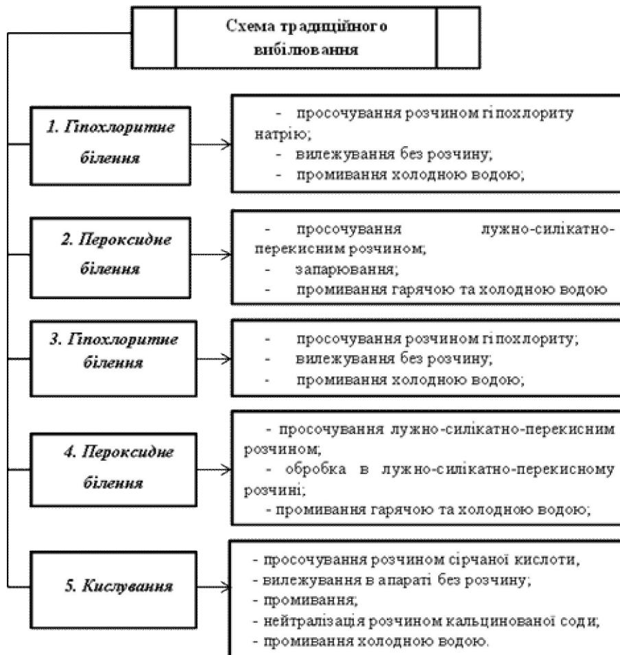
Рис. 1. Схема традиційного вибілювання лляної тканини на п'ятисекційній лінії ЛЖО-1-Л

Перспективним напрямком у створенні екологічно чистих технологій є повне виключення хлоромістких речовин при підготовці лляних текстильних матеріалів.