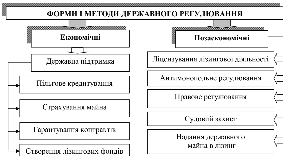
Рис. 1. Форми державного регулювання лізингової діяльності

лізинг пройшов шість важливих етапів: 1) найпростіша оренда; 2) простий фінансовий лізинг; 3) кредитивний лізинг; 4) операційний лізинг; 5) етап нових продуктів лізингу; 6) зрілий лізинг.