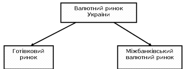
Рис. 2. Структура валютного ринку України

Сьогодні структура валютного ринку України включає два сегменти— міжбанківський ринок і ринок продажу готівки (рис. 2). Починаючи з 2000 р. НБУ проголосив політику плаваючого курсу, під яку було сформовано нині діючу структуру валютного ринку і систему здійснення валютних операцій.