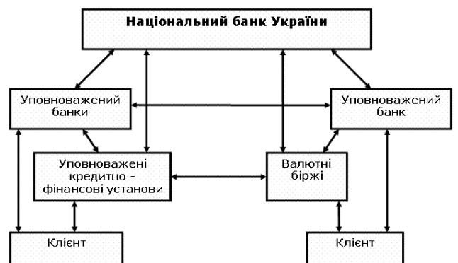
Рис. 3. Схема міжбанківського валютного ринку України

Міжбанківський валютний ринок України – це сукупність відносин у сфері торгівлі іноземною валютою в Україні між суб'єктами ринку, між суб'єктами ринку та їх клієнтами (у тому числі банками-нерезидентами), а також між суб'єктами ринку і Національним банком (рис. 3).