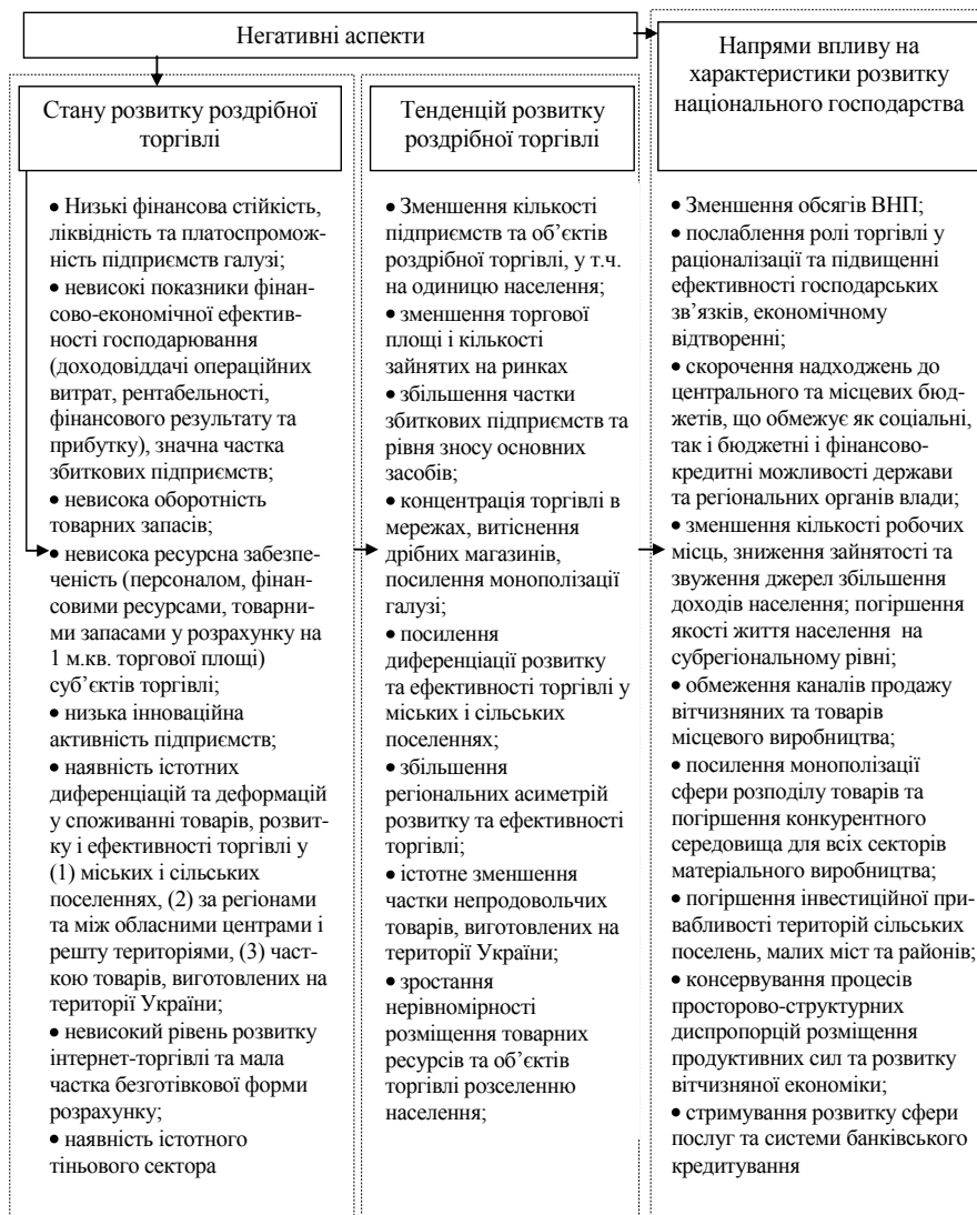
Рис. 3. Негативні наслідки недостатньо ефективного регулювання внутрішнього ринку в Україні

(структурних підрозділів) з розвитку інноваційної діяльності; покращенням структури кадрів та збільшенням частки керівників і фахівців з вищою освітою та з досвідом науково-дослідної роботи; ініціюванням створення кластерів за участю підприємств торгівлі, науково-дослідних установ, фінансово-кредитних організацій, інституцій інноваційної інфраструктури; удосконаленням асортиментної структури у напрямі розширення частки інноваційних товарів, а також над посиленням співпраці з виробниками та дистрибуторами інноваційної продукції.