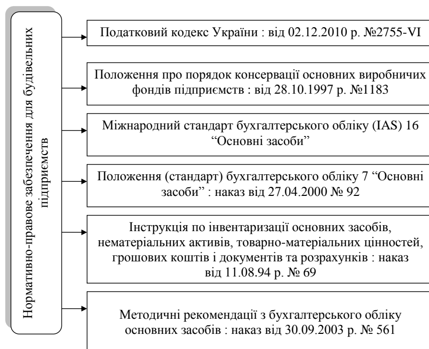
Рис. 1. Нормативно-правове забезпечення обліку консервації основних засобів (сформовано автором)

Варто зазначити, що у використанні термінології, наведеній у нормативно-правових актах, що стосуються регулювання обліку консервації основних засобів, наявні певні розбіжності. Наприклад, згідно з п. 2 Положення № 1183, консервація основних фондів підприємств – це комплекс заходів, спрямованих на довгострокове (але не більше трьох років) зберігання основних фондів підприємств у разі припинення виробничої та іншої господарської діяльності з можливістю подальшого відновлення їх функціонування [1].