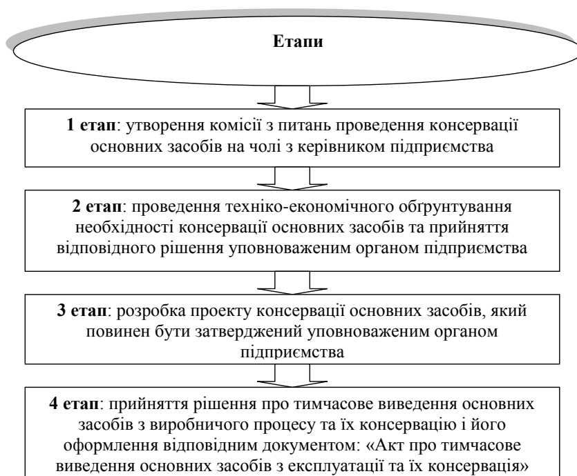
Рис. 2. Алгоритм порядку проведення консервації основних засобів будівельних підприємств (складено автором за даними [1])

Другий та третій етапи проведення консервації основних засобів розглянемо у їх взаємозв'язку. Відтак, техніко-економічне обґрунтування необхідності консервації основних засобів, згідно з Положенням № 1183 [1], включає: відомості про основні засоби підприємства, що підлягають консервації: найменування та місцезнаходження підприємства, орган, уповноважений управляти майном, для підприємств, заснованих на державній власності, (найменування власника (власників) – для інших підприємств), балансова вартість; проект консервації, який повинен складатися з пояснювальної записки, технологічної документації проведення консервації, переліку робіт, ресурсів (матеріальних і трудових) та кошторису витрат, пов'язаних з проведенням консервації і розконсервації основних засобів підприємства; акт технічного стану основних засобів на момент їх консервації; дані про облік