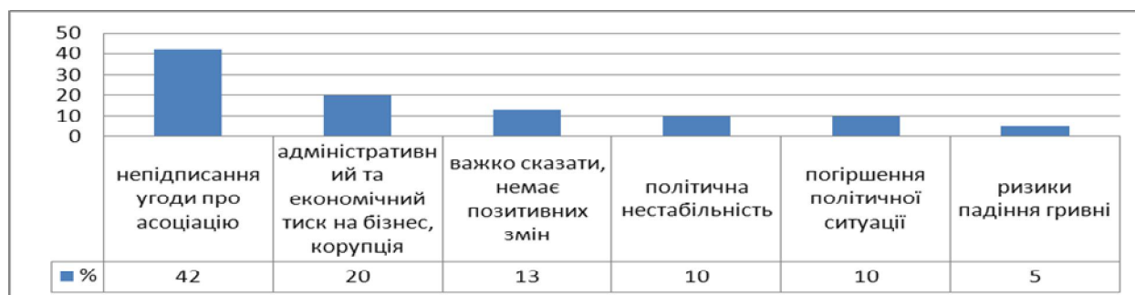
Рис. 1. Негативні зміни в інвестиційному кліматі економіки України протягом 4 кварталів 2013 р. [9]

Серед основних негативних змін в інвестиційному кліматі на сучасному етапі протягом останніх місяців є непідписання Угоди про асоціацію – 42% та адміністративний і економічний тиск на бізнес, корупція – 20%. Головний контекст цих оцінок – відсутність позитивної оцінки інвестиційного клімату в найближчій перспективі (рис. 1).