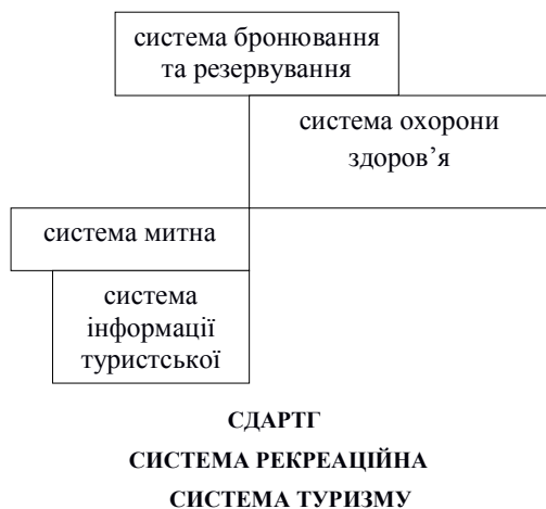
Рис. 1. Місце СДАРТГ у загальній системі розвитку туризму

При цьому, як у системах, до яких може належати СДАРТГ, так і тих, які можуть входити до неї, не враховано необхідність управління та регулювання таких сфер, як культурна й екологічна (природна). Отже, формування СДАРТГ – як складової загальних систем туризму та рекреаційної – з одного боку, й такої, що вміщує в собі інші розглянуті (табл. 1), дозволить усунути протиріччя порушення системного взаємозв'язку між сферами галузі – з наукової точки зору, а з практичної – на цих основах створити базис для виведення галузі з кризи з метою забезпечення її подальшого розвитку. З цієї точки зору, місце СДАРТГ у загальній системі розвитку туризму можна виразити через взаємозв'язок між сферами галузі та іншими системами (рис. 1).