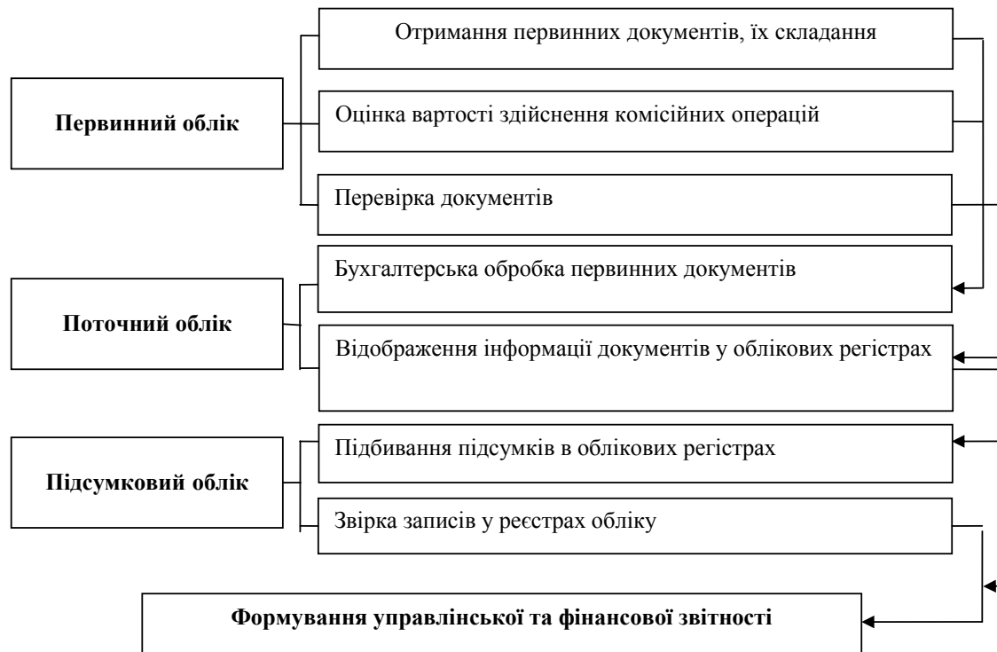
Рис. 2. Схема організації обліку комісійних операцій

Витрати на проведення комісійних операцій підлягають суцільному і безперервному документуванню господарських операцій та процесів, пов'язаних із використанням матеріальних, трудових і інших ресурсів, що оформляється первинними документами. Накопичення та групування інформації відбувається у подальшому в регістрах обліку на основі даних первинного обліку.