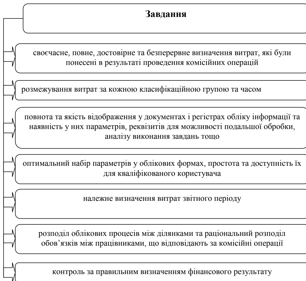
Рис. 1. Основні завдання раціональної організації обліку комісійних операцій

Послідовність організації обліку витрат на проведення комісійних операцій подана нами на рис. 2.