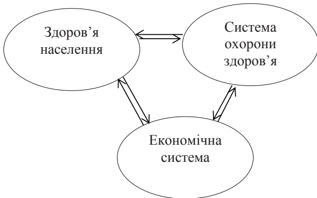
Рис. 1. Взаємозв'язок здоров'я населення, системи охорони здоров'я та економічної системи

вещь багаторічний внесок держави в розвиток цієї надзвичайно важливої соціальної галузі, що викликало повний її занепад, розлад, кризовий стан. Фінансування охорони здоров'я з державного бюджету здійснюється лише на 50-60% від необхідного мінімуму за оптимістичними оцінками, з песимістичних – фігурують цифри – 30-44%. Сьогодні фінансування охорони здоров'я орієнтовано головним чином на утримання галузі (хоча доцільно був би – на лікування хворого) [1].