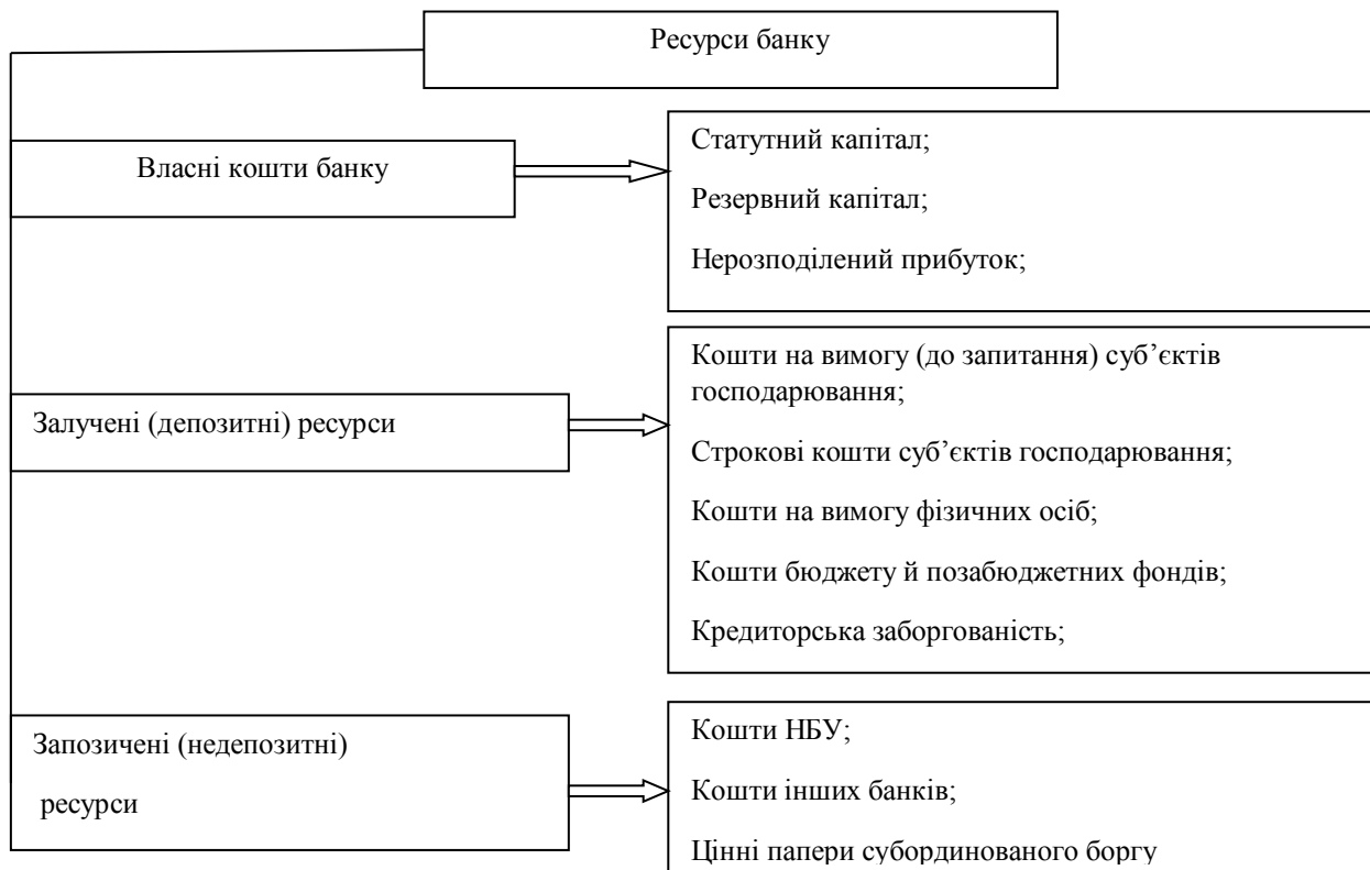
Рис. 3. Класифікація ресурсів банку за джерелами формування

внутрішнього характеру. Зовнішніми чинниками впливу є: незадовільний стан світової та національної фінансово-економічних систем, недосконалість грошово-кредитної політики центрального банку, недосконалість законодавчої бази, підірвана довіра до кредитних установ, нерозвиненість ринку страхування та фондового ринку тощо. Найбільш вагомим чинником внутрішнього характеру щодо накопичення ресурсних проблем банків є: недостатній рівень капіталізації банків, а внаслідок цього – ненадійність,