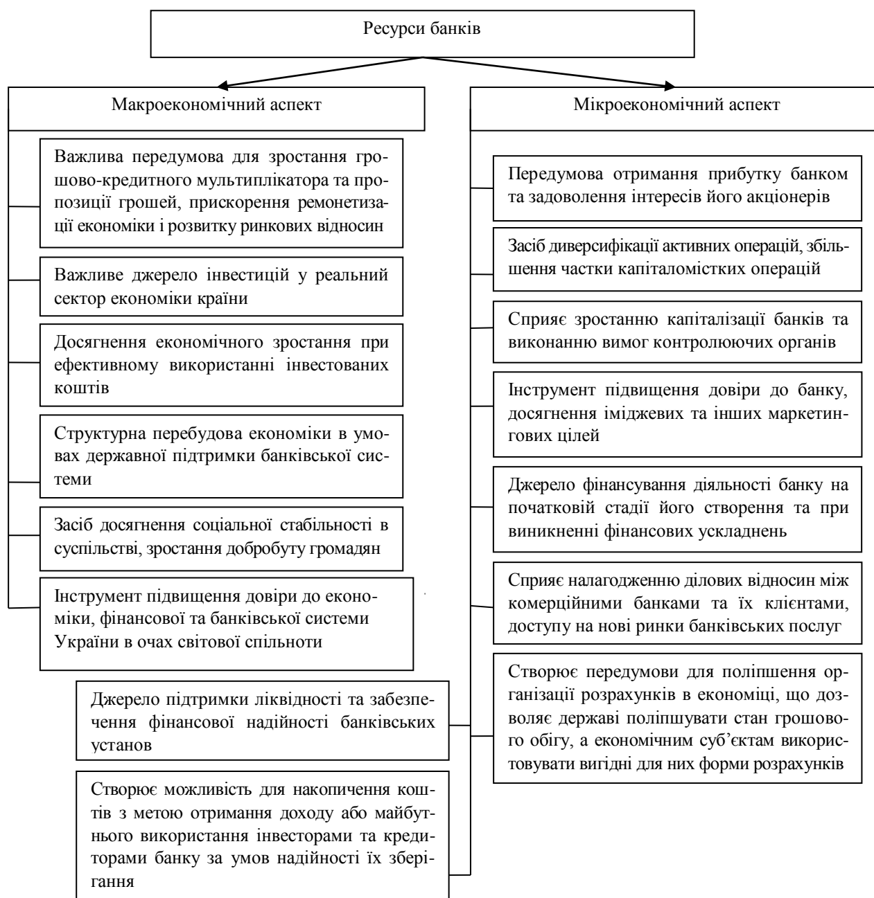
Рис. 1. Макро- та мікроекономічний аспекти формування ресурсів банків

Найбільша частина пасивів банку, яка в декілька разів перевищує його власні кошти, - залучені кошти, що визначає специфіку банку як посередника у сфері фінансових відносин. Залучені кошти виступають основним джерелом формування ресурсів банку, які в подальшому спрямовуються для використання у формі проведення активних операцій. У банківській практиці всі рахунки клієнтів, відкриті в банку, узагальнено називають депозитами, а отже, залучені кошти – депозитними зобов'язаннями.