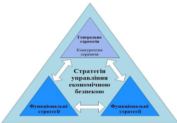
Рис. 1. Місце стратегії управління економічною безпекою підприємства в стратегічному наборі підприємства (авторська розробка)

Забезпечення економічної безпеки підприємства формується за локальними складовими [2, с. 142], які можуть виступати блоками функціональної стратегії, які знаходяться в тісному взаємозв’язку.