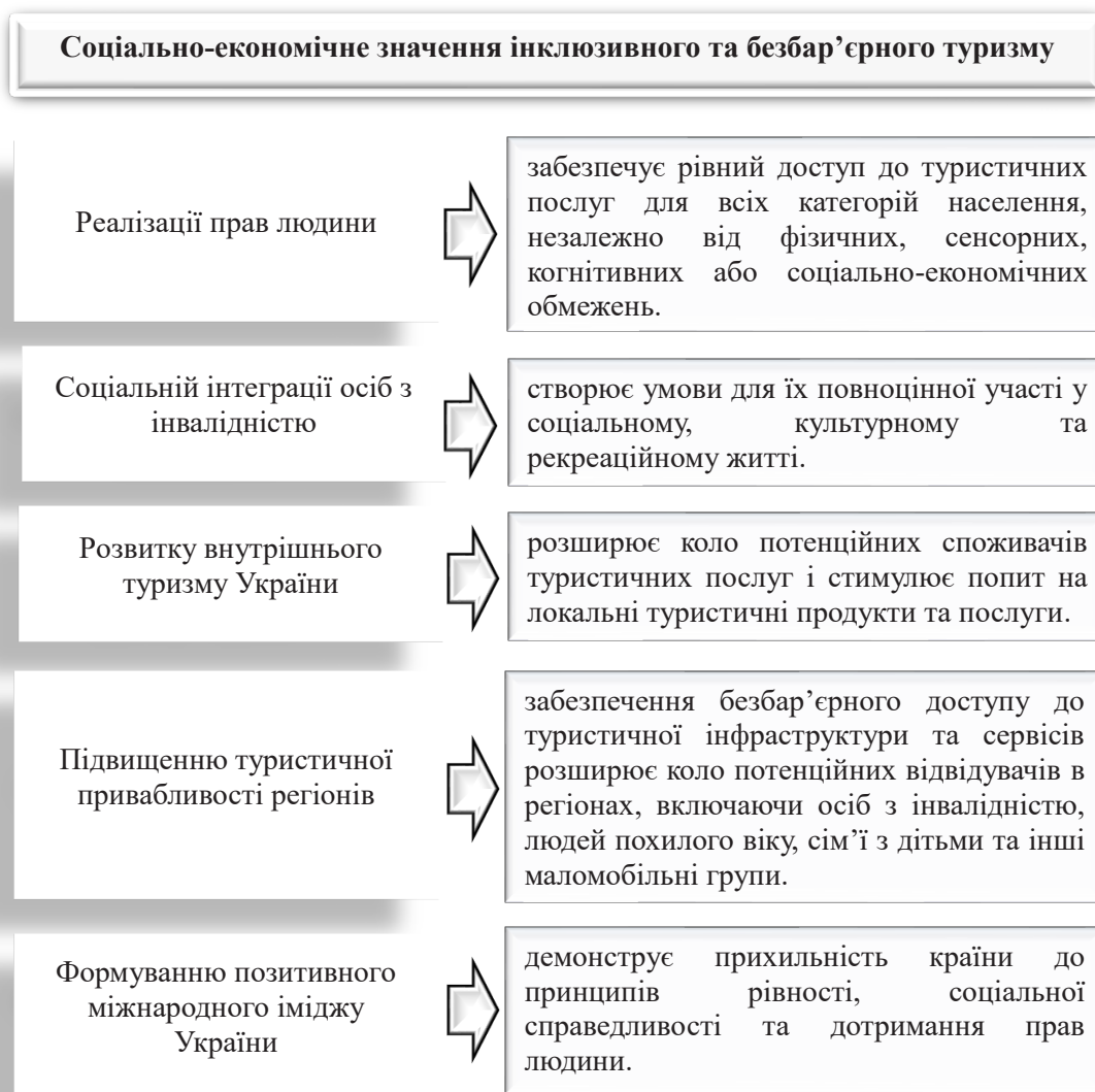
Рис. 3. Соціально-економічне значення інклюзивного та безбар'єрного туризму для України