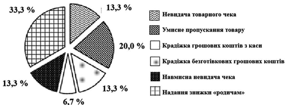
Рис. 1. Статистика шахрайства та фродів за допомогою касового обладнання у підприємства «Стиль» за 2019–2023 рр.

Згідно з рис. 1 найбільш поширеним видом касового шахрайства є «Надання знижки «родичам»». Вищевказана дія є протиправною, оскільки продавець передає третім особам свою дисконтну картку для того, щоб вони могли отримати знижку в розмірі 25% від суми чека. Сума збитків від даного виду фроду (шахрайства) є невеликою для компанії і становить 30 740 грн. (2,56% від середнього місячного виторгу в 2023 р.). Що стосується найбільш значного злочину на підприємстві – розкрадання безготівкових грошових коштів, то даний вид правопорушення становить найменший відсоток, оскільки торговельний заклад зіткнувся з ним тільки один раз. Збиток, понесений від даного злочину, був най-