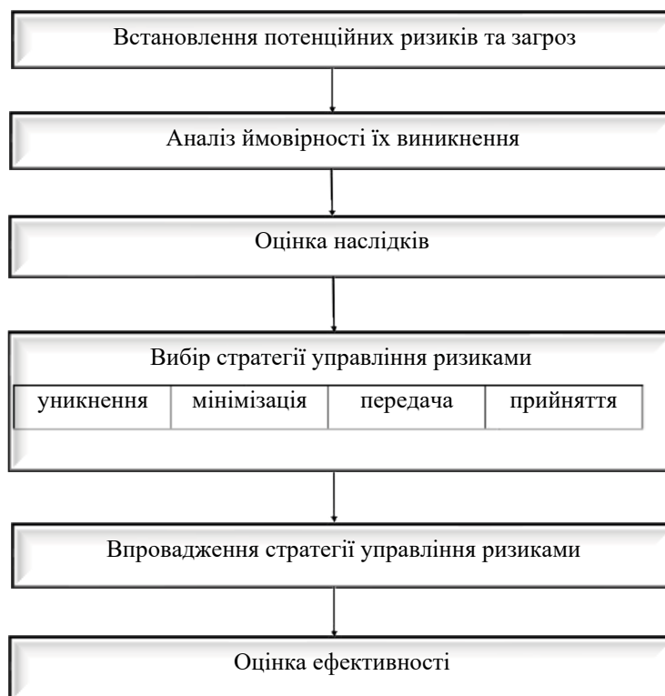
Рис. 2. Процес управління ризиками туристичного підприємства