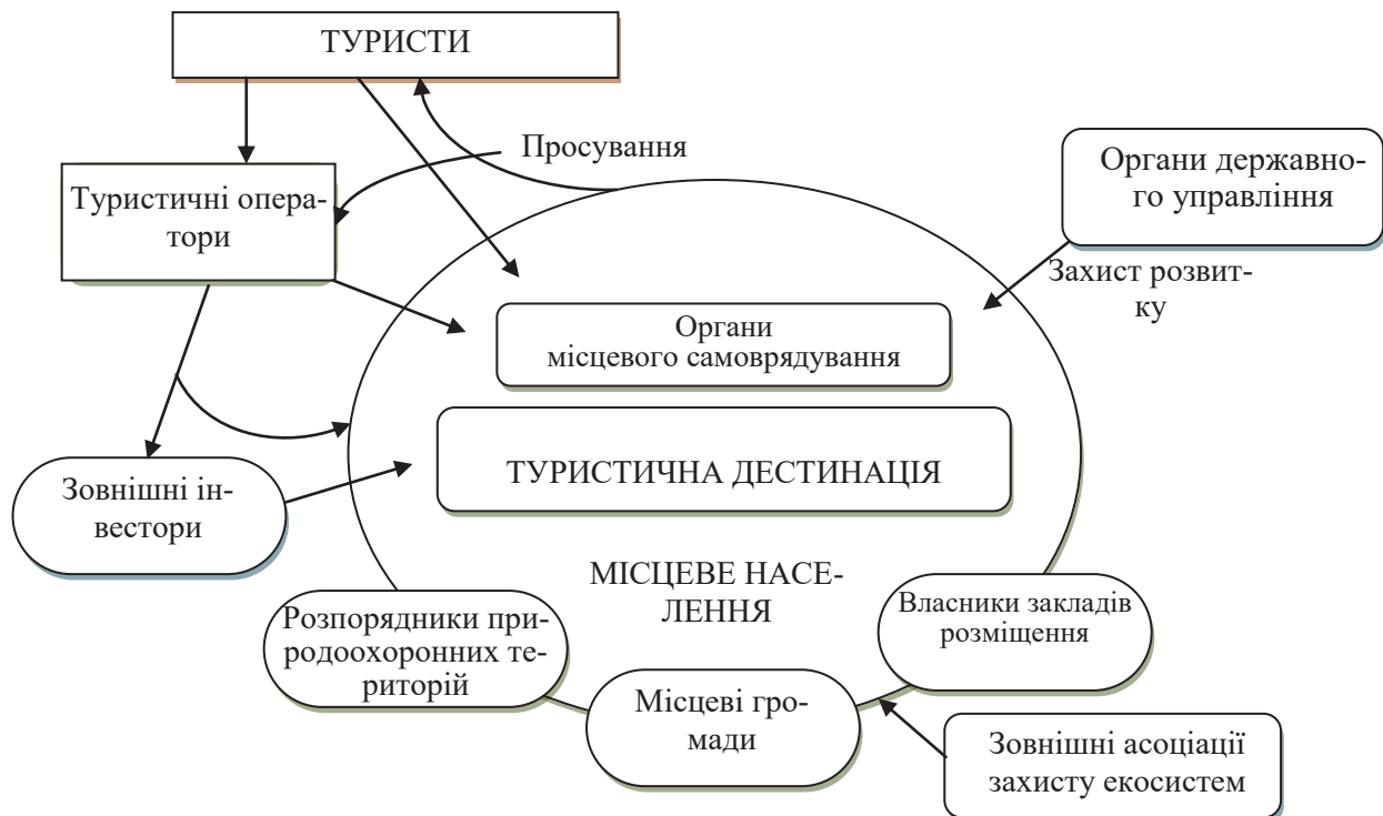
Рис. 1. Коло стейкхолдерів в управлінні сталим розвитком туризму на природоохоронних територіях