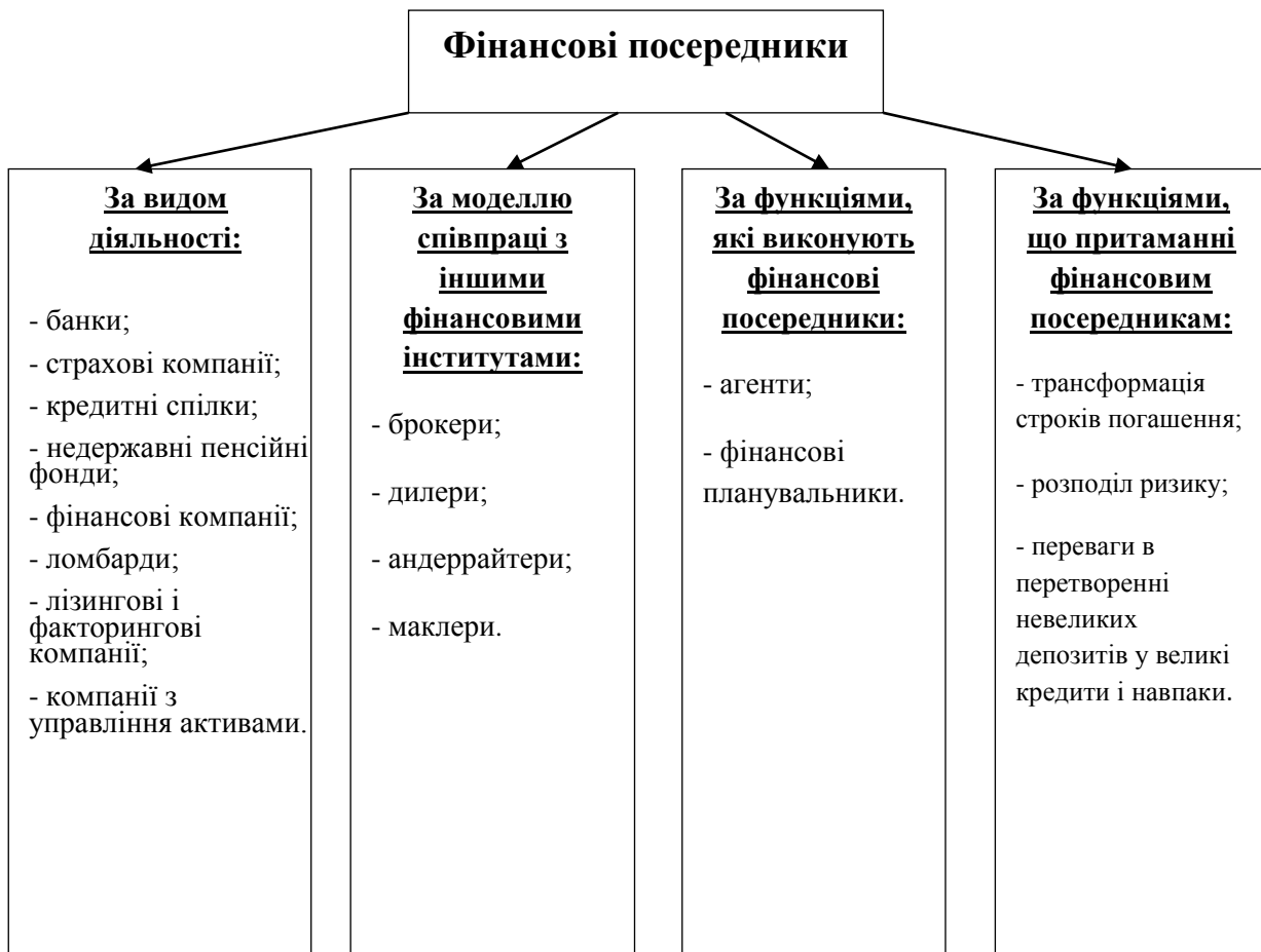
Рис. 1. Класифікація фінансових посередників за обраними ознаками (самостійна розробка)

Іноземні науковці в складі досліджуваної категорії окремо виділяють фінансового посередника, кредитного посередника (різновид фінансового посередника), фінансового консультанта (який допомагає вибрати фінансову послугу) [7, с. 128]. Для усунення розбіжностей в трактуванні фінансового посередництва доцільно здійснити класифікацію фінансових інститутів відповідно до ознак їхнього функціонування та діяльності (рис. 1).